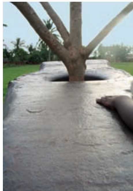
Aus dem Afrika-Hammer wächst der Feuerbaum