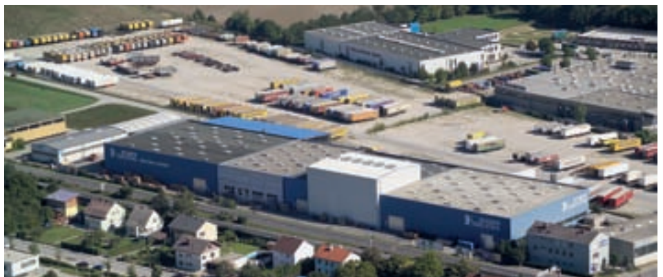
Seit über 30 Jahren ist Bogner Wels das Zentrallager für Österreich und Osteuropa

In der firmeneigenen Bogner Edelstahl Academy werden die Mitarbeiter weitergebildet, um konsequent die Effizienz und Qualität der Arbeit zu steigern. Bogner bezieht seine Mitarbeiter auch in die Entwicklung von Innovationen ein. In den